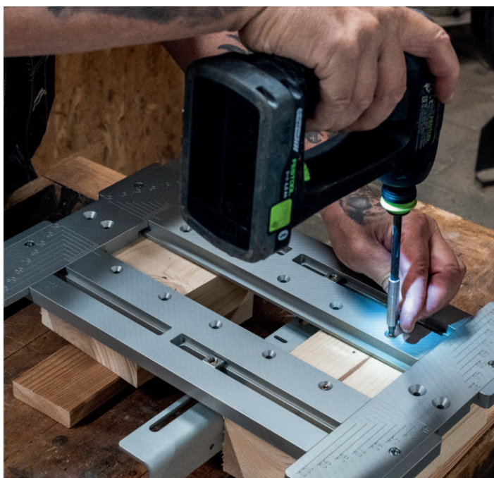
Die MIMO315 im Einsatz in einer Tischlerwerkstatt