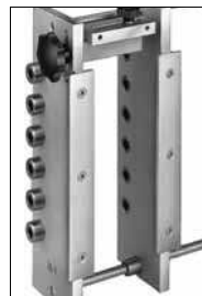
Balkenträger ≥ 120