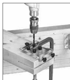
für: Balkenträger 90, Stützenfüße PIG, PIL, PIS, PISB, PVI, PVIB, PJIB, PJIS